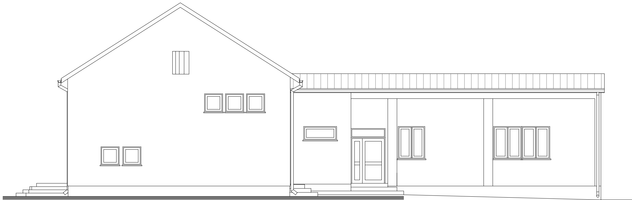
ELEWACJA POŁUDNIOWA - STAN ISTNIEJĄCY 1:100